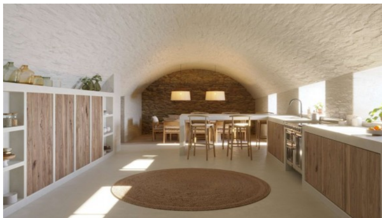
Vivenda Uofriu ESTAT ACTUAL